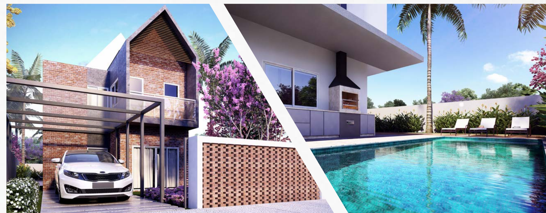
UMA VISÃO CONTEMPORÂNEA DO JEITO DE MORAR.