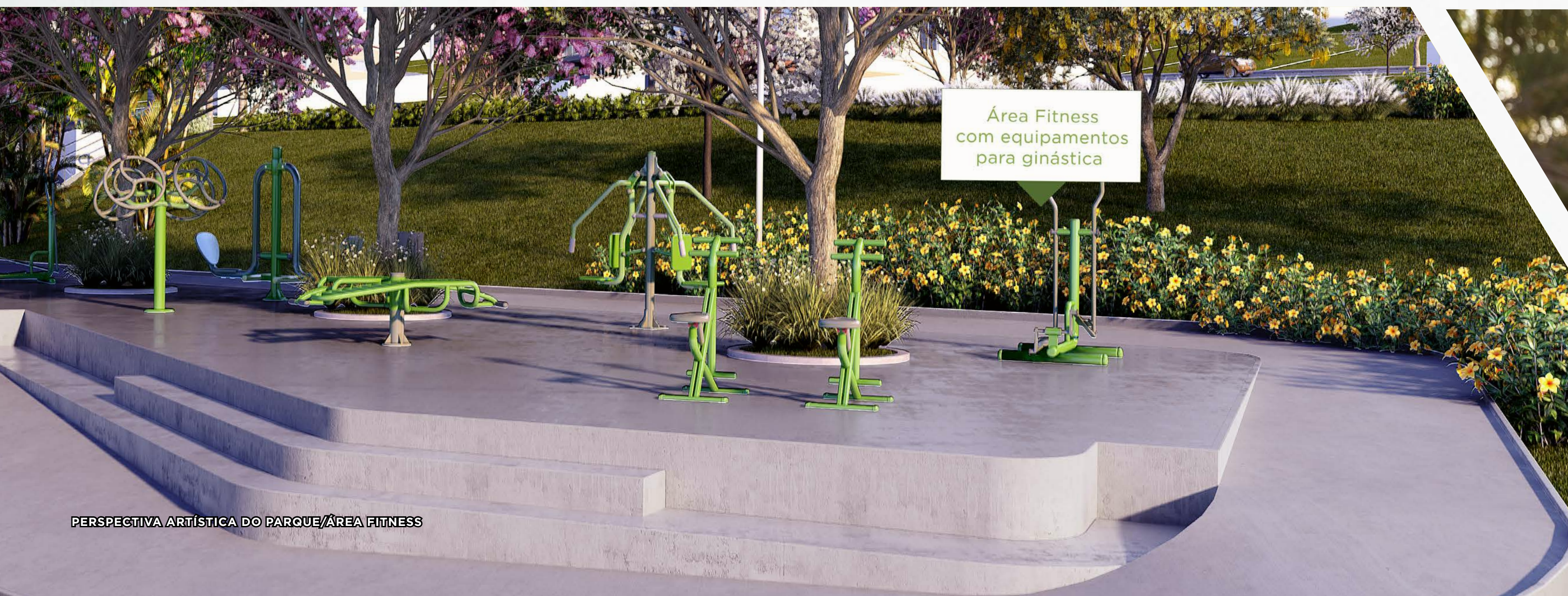
PERSPECTIVA ARTÍSTICA DO PARQUE/ÁREA FITNESS