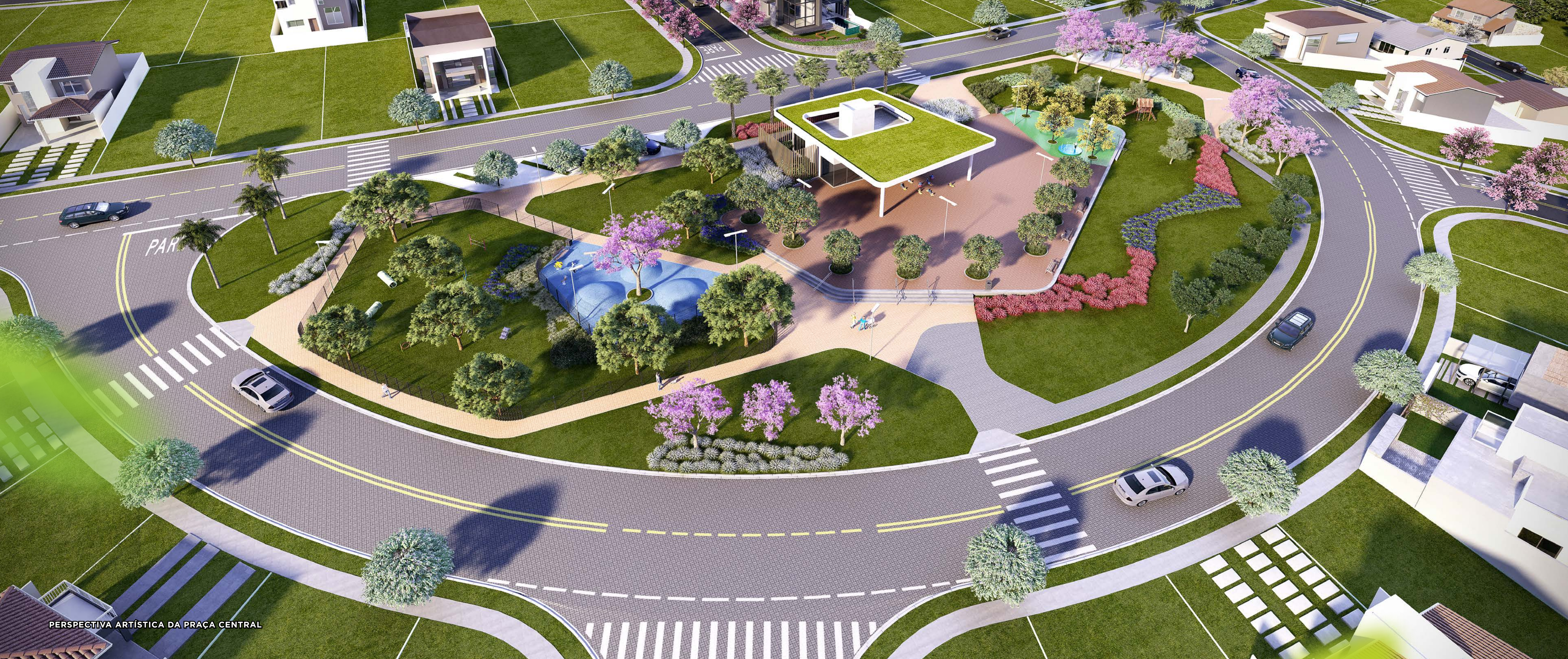
PERSPECTIVA ARTÍSTICA DA PRAÇA CENTRAL

UM LUGAR FEITO PARA VOCÊ CURTIR COMO QUISER.