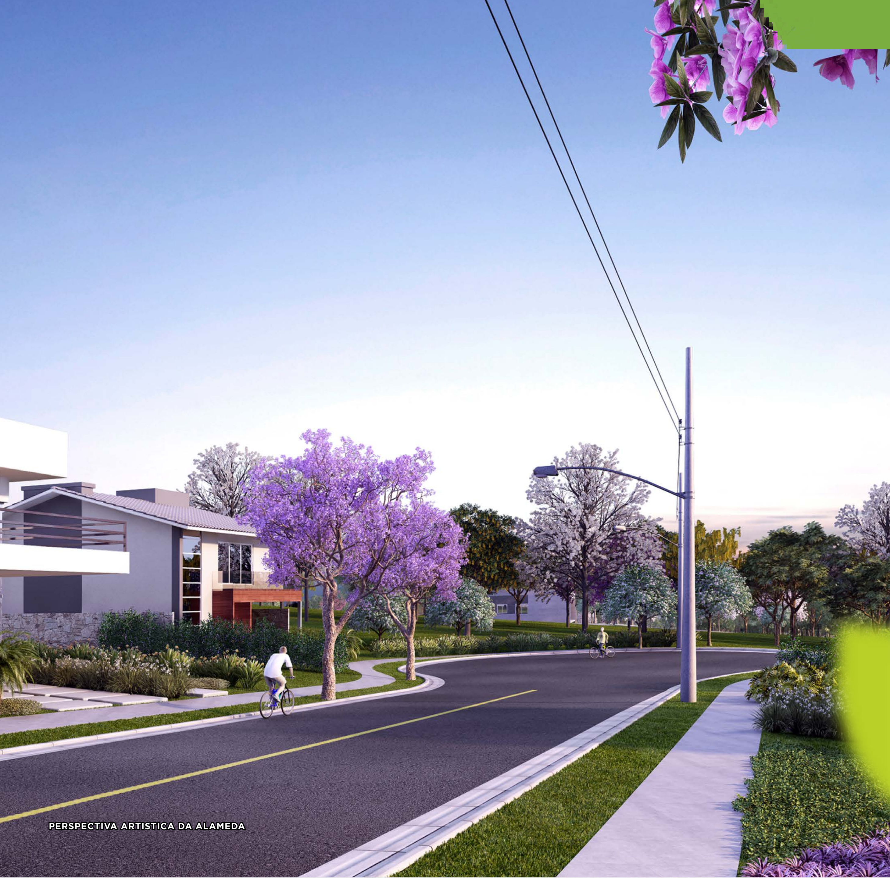
PERSPECTIVA ARTISTICA DA ALAMEDA