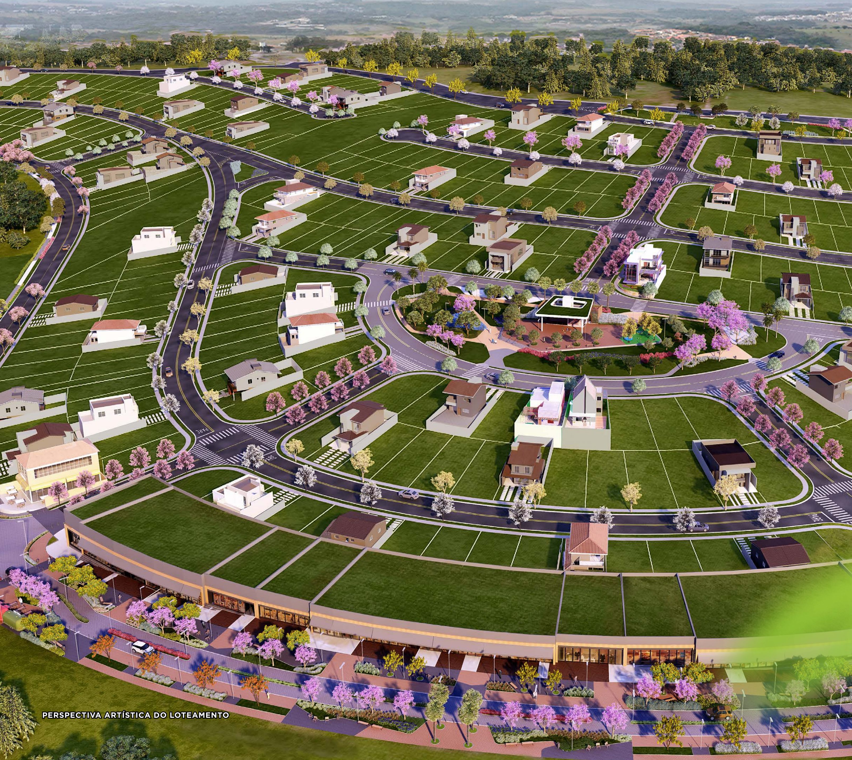
PERSPECTIVA ARTÍSTICA DO LOTEAMENTO