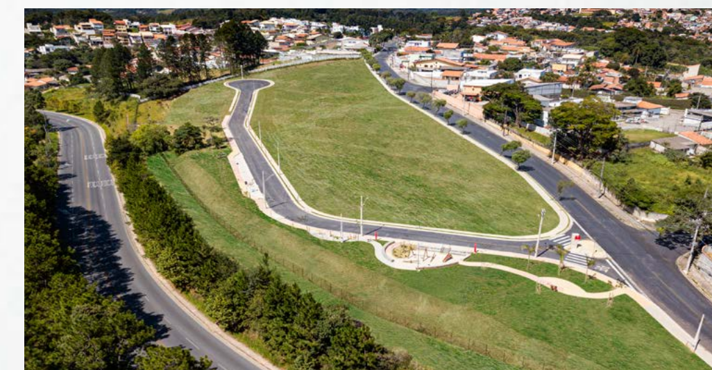
RESERVA DAS PAPOULAS - SÃO PAULO