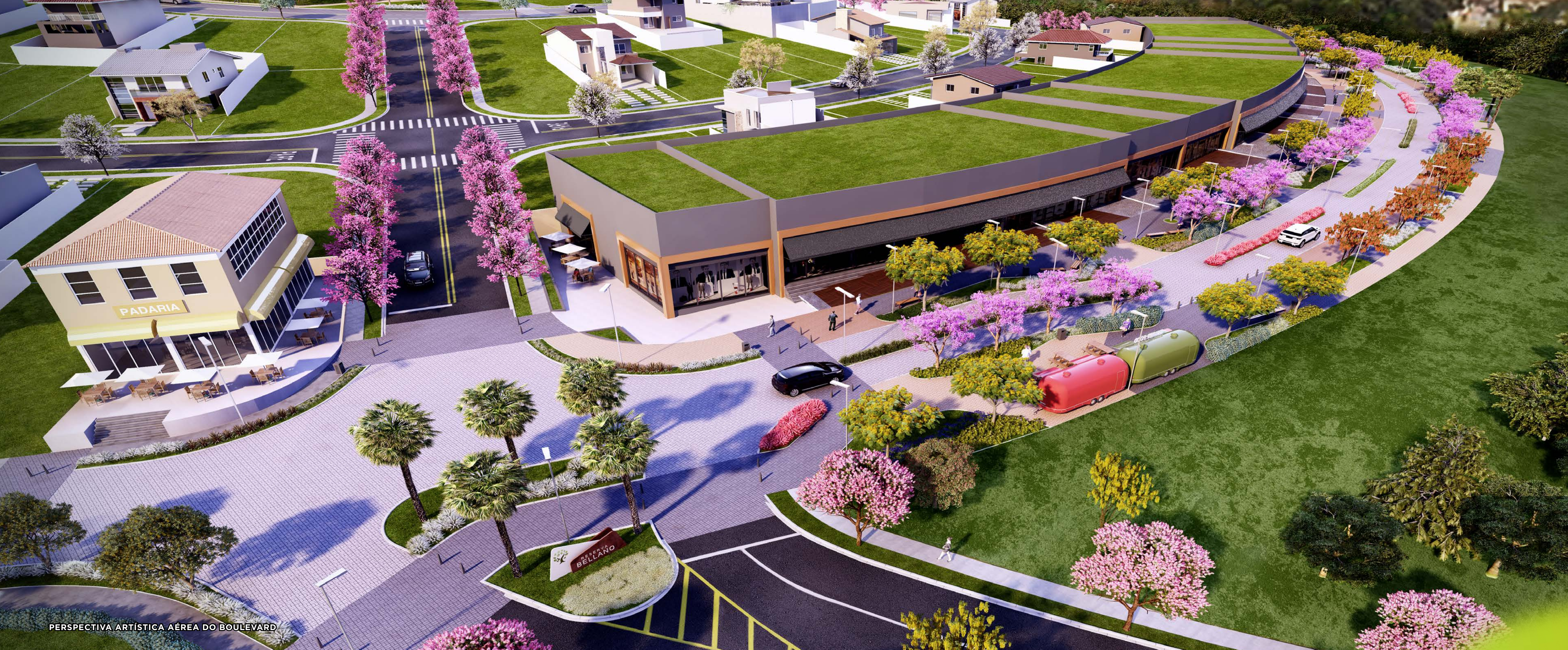
PERSPECTIVA ARTÍSTICA AÉREA DO BOULEVARD

A GENTE PLANEJOU O BAIRRO, VOCÊ PLANEJA A SUA VIDA.