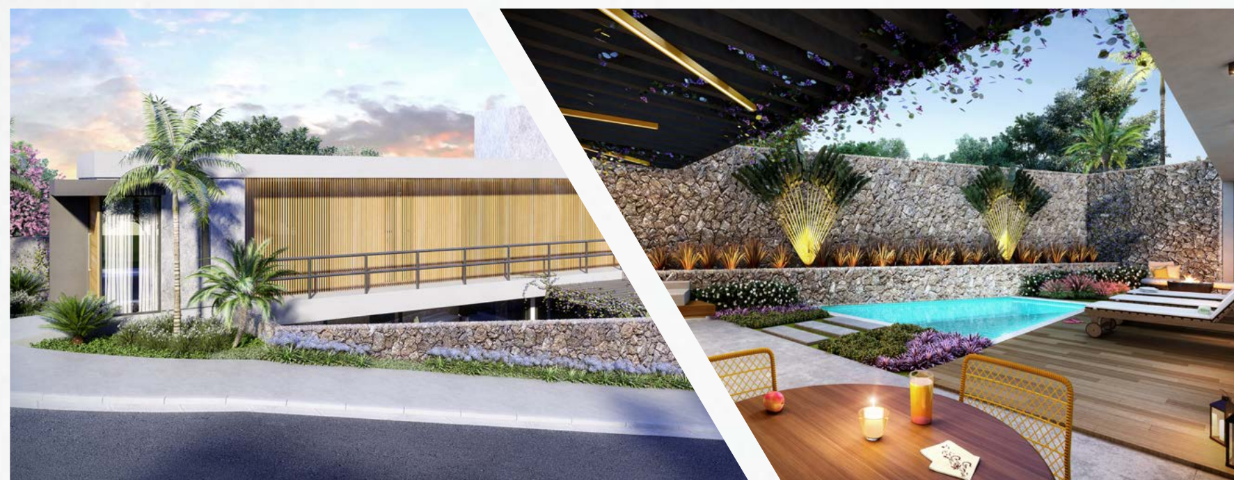
INTEGRAÇÃO ENTRE O ESPAÇO INTERNO E EXTERNO, APROVEITANDO A CONFIGURAÇÃO DO TERRENO.