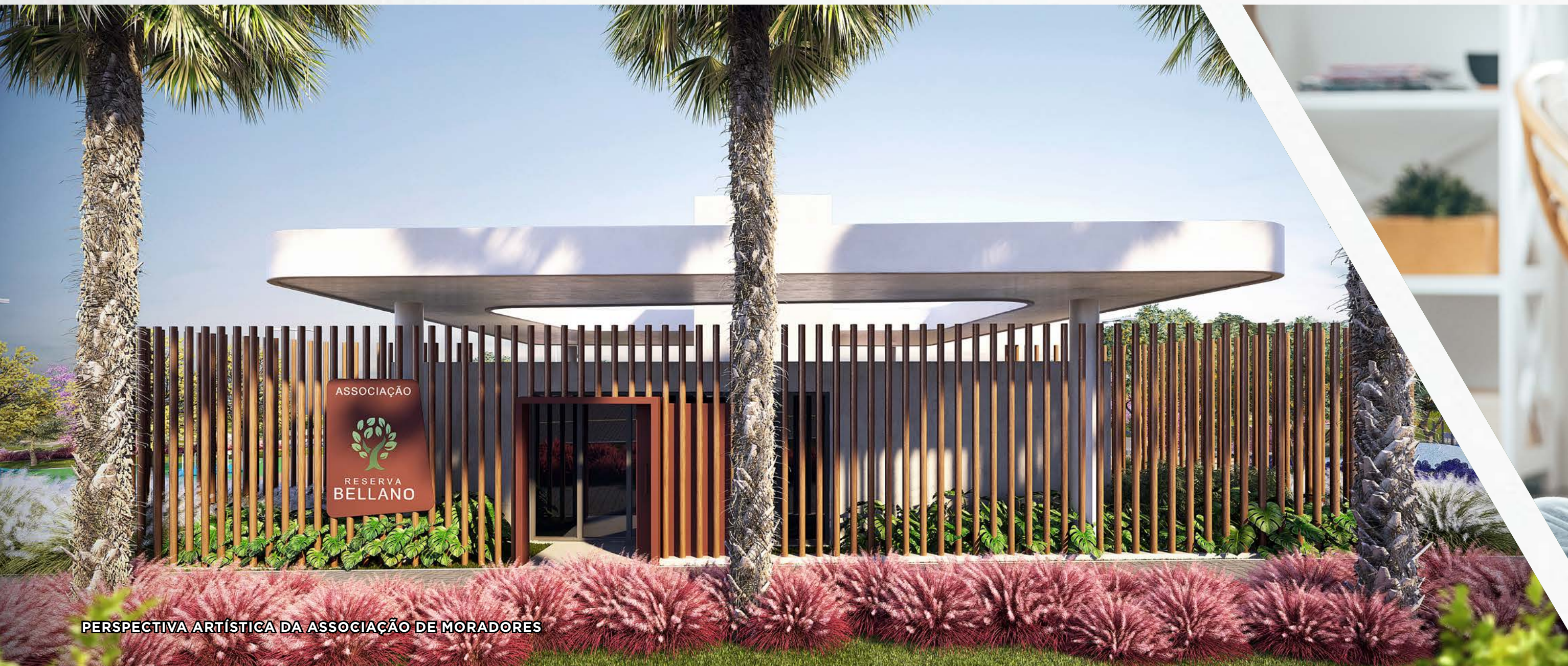
PERSPECTIVA ARTÍSTICA DA ASSOCIAÇÃO DE MORADORES