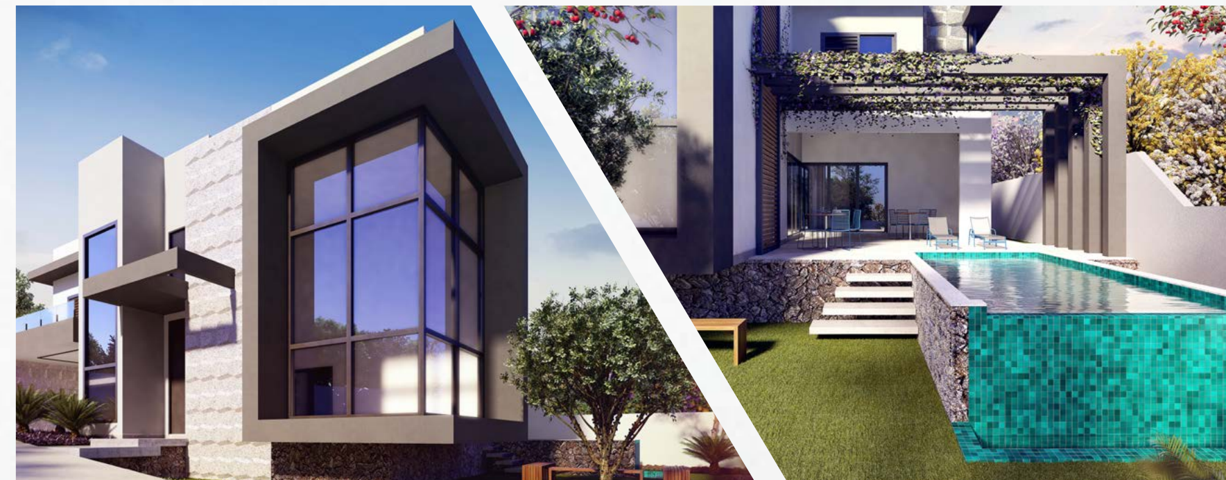
NATUREZA DO ENTORNO PARA DENTRO DA CASA.