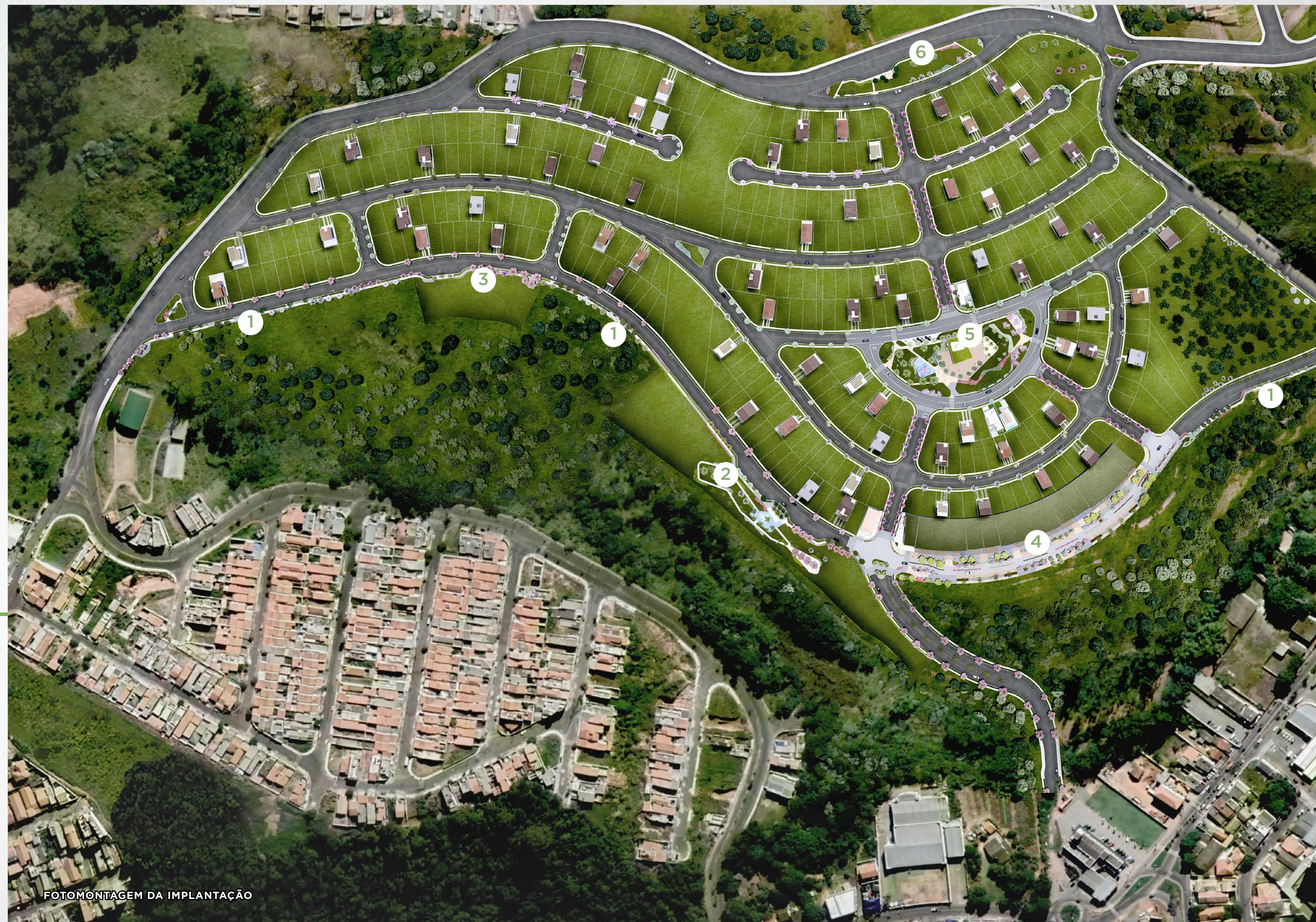
FOTOMONTAGEM DA IMPLANTAÇÃO