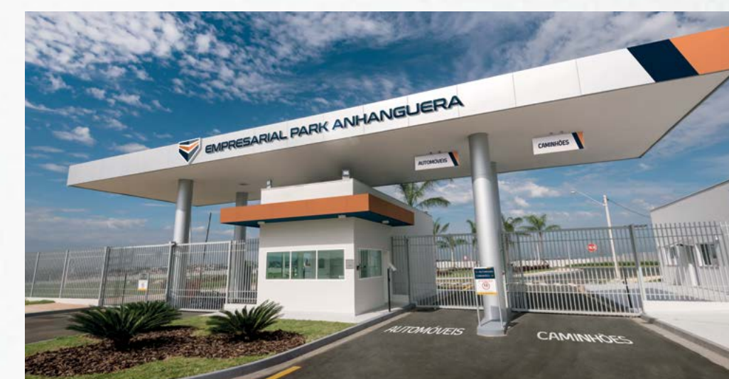
EMPRESARIAL PARK ANHANGUERA - SÃO PAULO