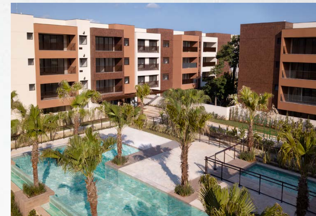
LAS VILLAS IPIRANGA - SÃO PAULO