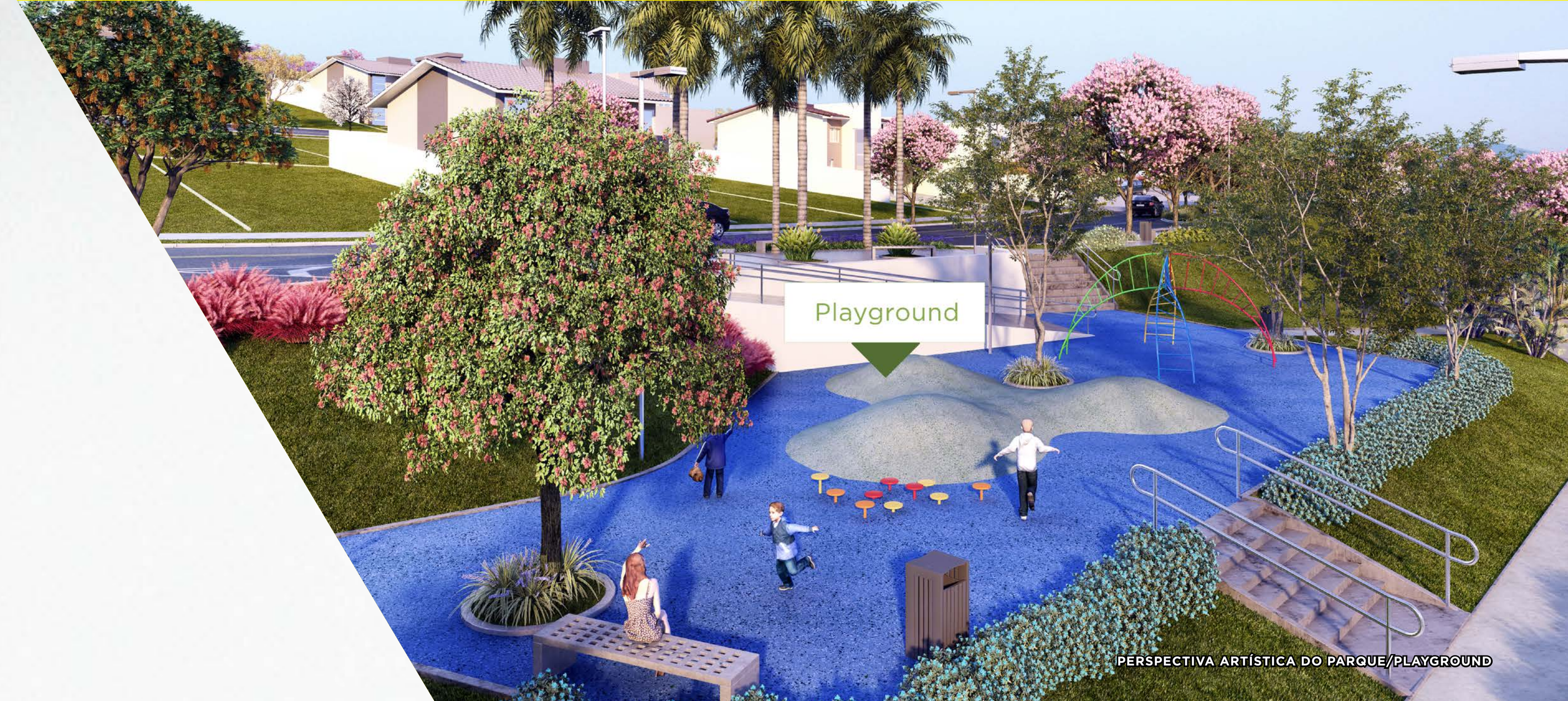
PERSPECTIVA ARTÍSTICA DO PARQUE/PLAYGROUND

UM BAIRRO NÃO É COMPLETO SEM A NATUREZA POR PERTO: MAIS DE 10 MIL ÁRVORES PLANTADAS PARA PRESERVAR O NOSSO FUTURO.