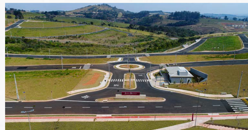
JARDIM BONANÇA - SÃO PAULO